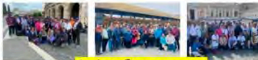
Our happy Europe passengers...