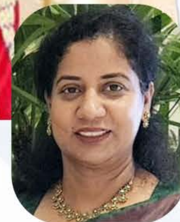
Mini Edakara Pgm Committee Member