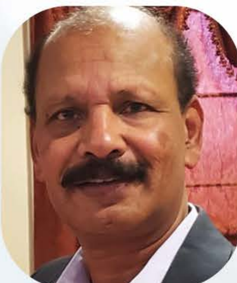
Sunny Meledom Parish Council Secretary