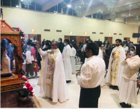
THREE DAY FASTING AND TRADITIONAL VESPERS CELEBRATED