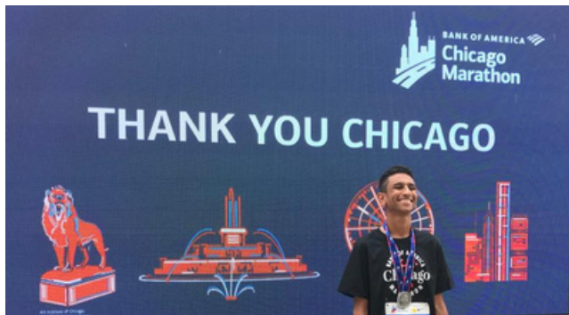
4TH PLACE IN UNDER 20 CHICAGO MARATHON 2021