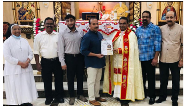
WEEKLY BULLETIN REPUBLISHED