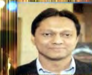
JOHN D SHALOM MINISTRY