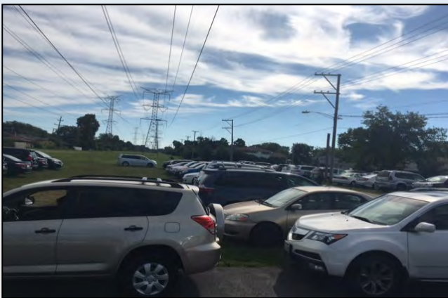
Parking during regular 10am Sunday mass

St. Mary's Knanaya Catholic Church really needs to expand its parking lot. Currently, it only has about 150 parking spots and there is not enough parking for regular 10am Sunday mass. As you can see from the pictures below, people are parking on the grass on the left and right side of the current parking lot and also in front side of the church. During the winter months, many people get stuck in the snow and had to be pushed/pulled out. No one wants to get stuck in the snow with family. During special holidays like Christmas and Easter, finding a parking spot is very difficult. Same is true for wake and funeral events. Thus, the expansion of the parking lot is needed and it will benefit each and every member of our church. It is the desperately needed necessity.