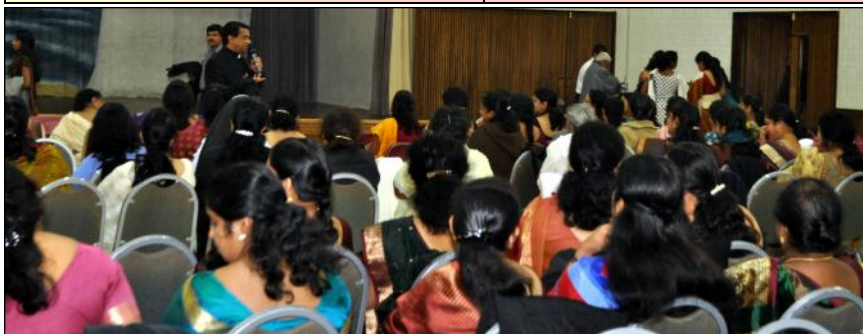
Women Ministry planning session held at St. Mary's.