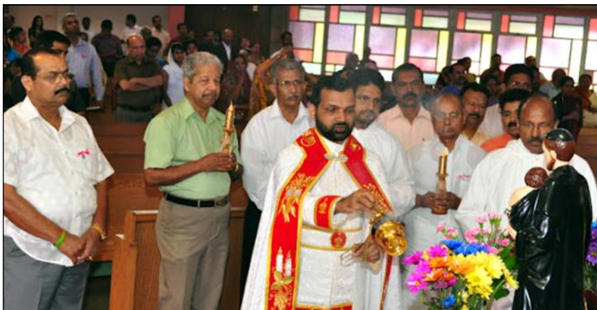
Feast of St. Vincent de Paul held at Sacred Heart Church.