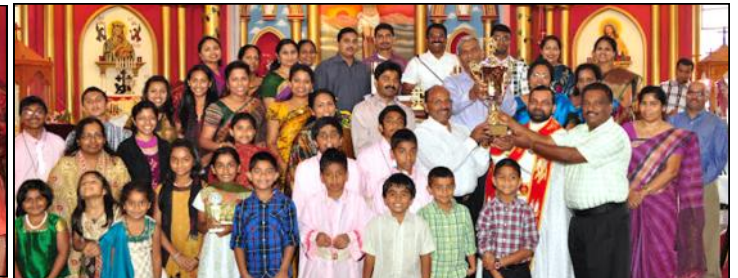
Prize distribution to Koodara Yogams that performed well on parish anniversary at Sacred Heart.