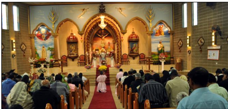
10 day Rosary and Adoration held at St. Mary's Church.