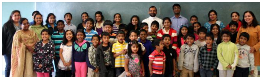
Malayalam Class staff and students at Sacred Heart.