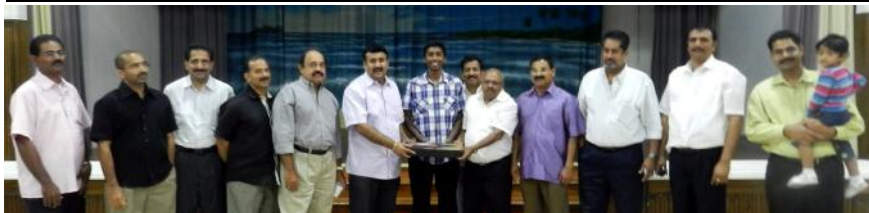
Special monthly auction held at St. Mary's Church.