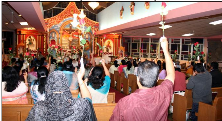
Feast Celebration of St. Therese of Child Jesus at Sacred Heart.