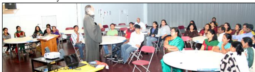
Religious Education staff training at Sacred Heart.