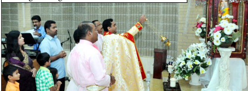
Feast Celebration of St. Augustine at St. Mary's Church.