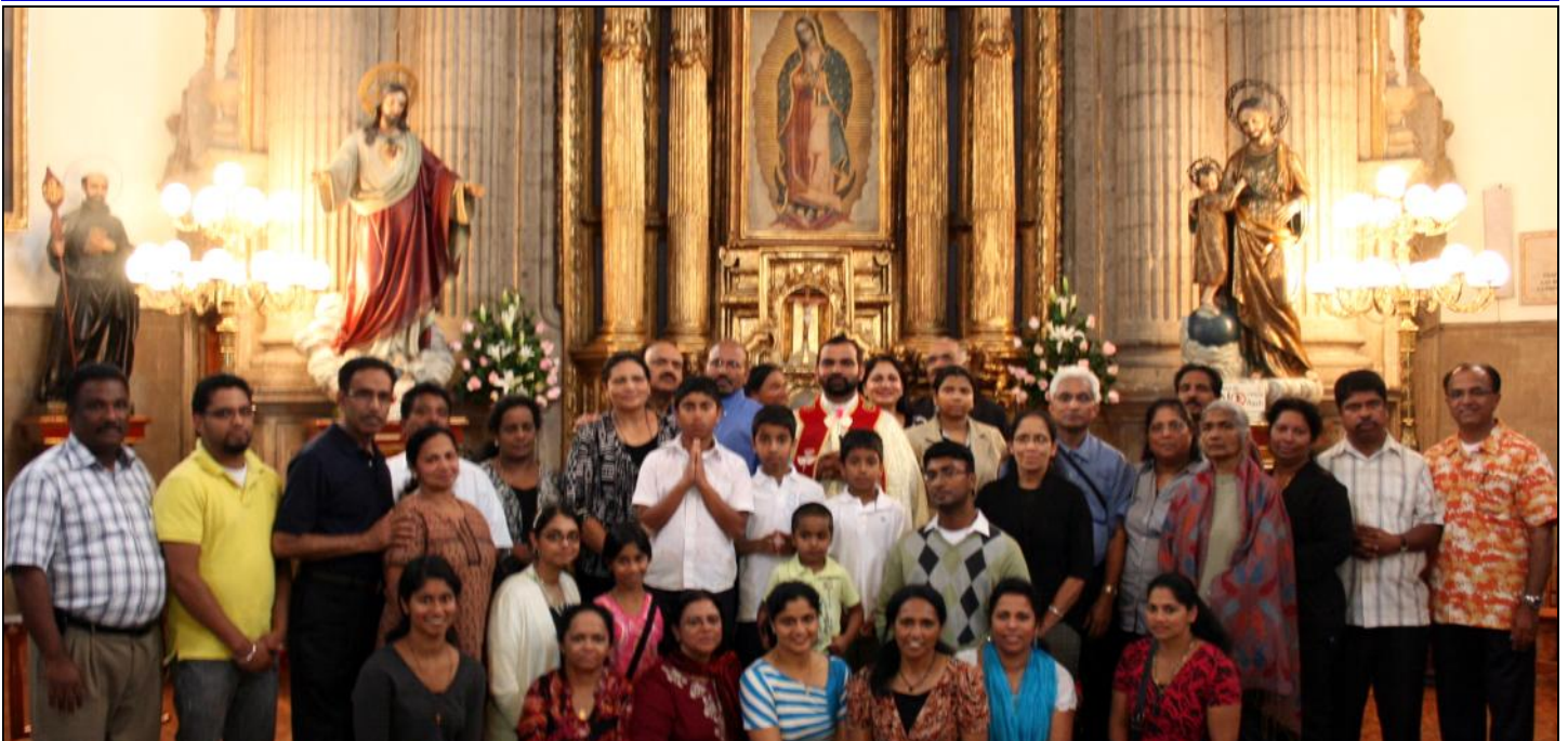
Participants of Pilgrimage to Our Lady of Guadalupe Basilica in Mexico from Sacred Heart Church.

Interpretation of the Picture: Jesus Transfiguration on mount Tabor was a foretaste of the heavenly bliss to the selected THREE. The presence of Moses and Elijah there proclaims Jesus as the fulfillment of the Law and the Prophets. Three tents signify the presence of Jesus in the Church. The constant working of the Holy Spirit also is pictured. The faithful experience this bliss primarily in the Qurbana celebration and in the Divine Praises, the Liturgy of the Hours.