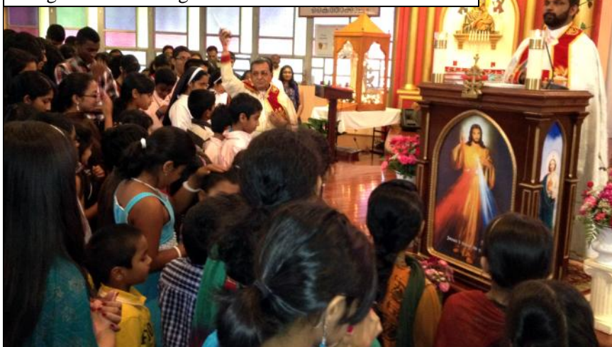
Blessing of Religious Edu. Students at Sacred Heart.