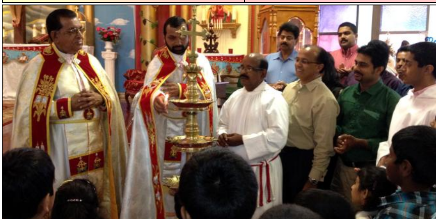
Inauguration of Religious Edu. School at Sacred Heart.