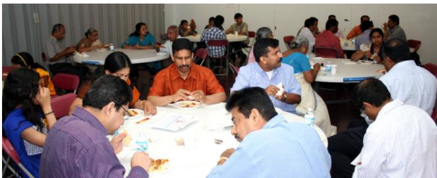
Rel. Education Teachers' appreciation lunch at Sacred Heart Parish.

FIRST HOLY COMMUNION AND CHRISMATION AT SACRED HEART CHURCH On Sunday June 10th at 10:00 A.M.