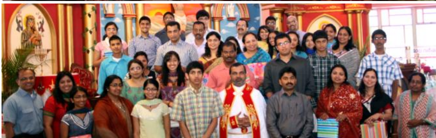
Religious Education Teachers appreciation at Sacred Heart.