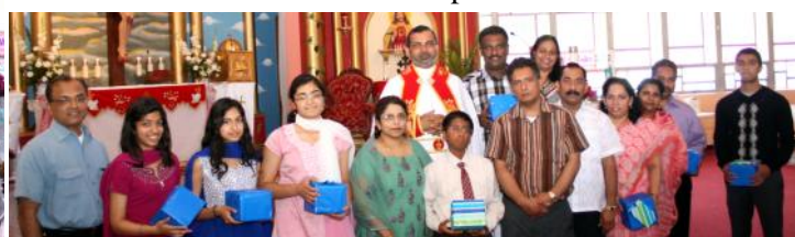
Winners of adult Bible Quiz. Appreciation at Sacred Heart for youth teachers graduating from High School

Adoration of this month for Sacred Heart and St. Mary's churches will be on Thursday, June 7th after 7:00 P.M. Mass on the feast of Body & Blood of Jesus.