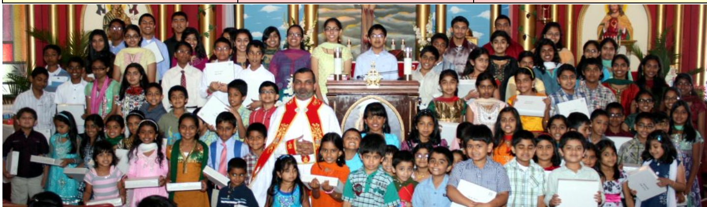
Perfect attendance award recipients at Sacred Heart.