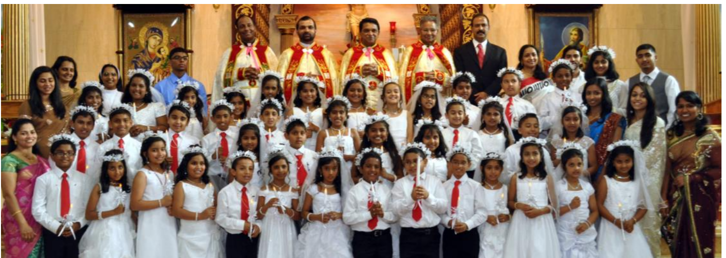
First Communion and Chrismation students with priests and trainers at St. Mary's Knanaya Catholic Church, Chicago.

Feast Sponsored by St. Michael's Koodara Yogam of Sacred Heart Parish.