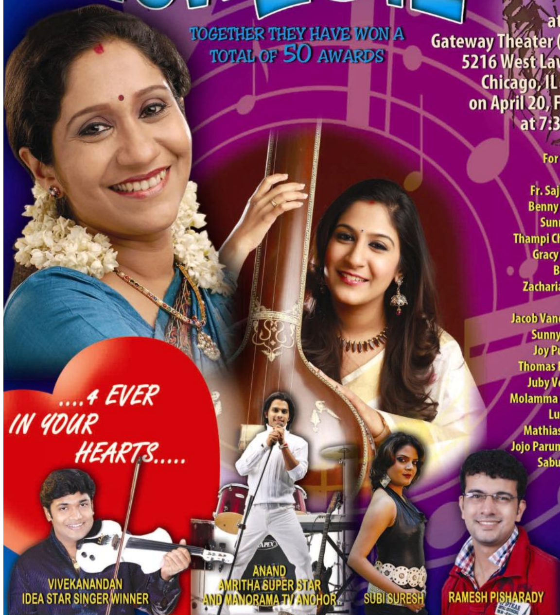
VIVEKANANDAN IDEA STAR SINGER WINNER