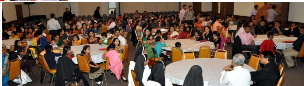
Photo right: Lunch of First Communion students and parents with Bishop.