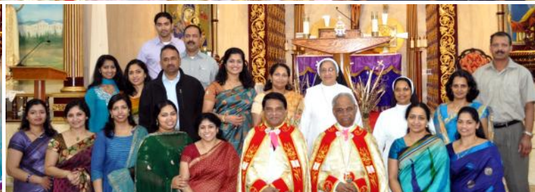
Photos above: Altar servers, Children choir, and Some Religious Education teachers.