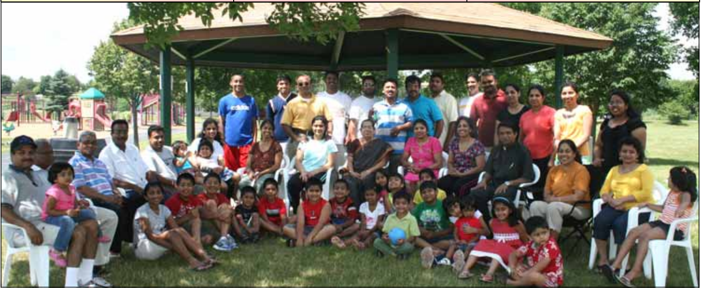
Participants of St. Michael's Koodarayogam Picnic held at Discovery Park, Orland Park on Saturday July 25, 2009.