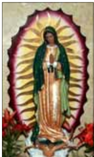
- One faithful