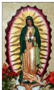
- One faithful