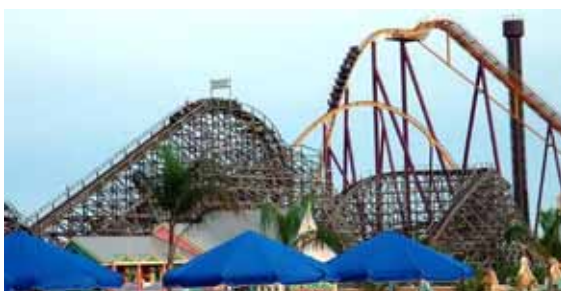
Six Flag Great America Trip by High School Students of Our Religious Education School on Saturday May 16 th .