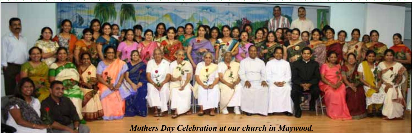
Mothers Day Celebration at our church in Maywood.