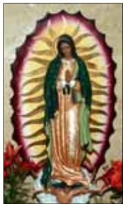
- തോമസ് ആലുങ്കൽ