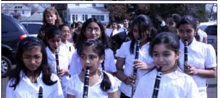
Procession with junior chenda team and church band of our parish during the feast celebration of St. Joseph by the Religious Education School and sponsored by children of St. Mary's Prayer Group.