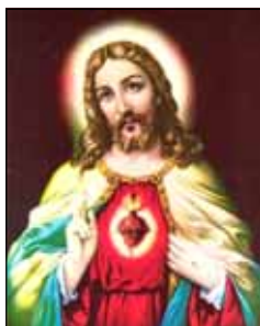
- തോമസ് ആലുങ്കൽ