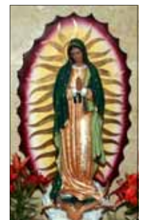
- മോളമ്മ തൊട്ടിച്ചിറയിൽ