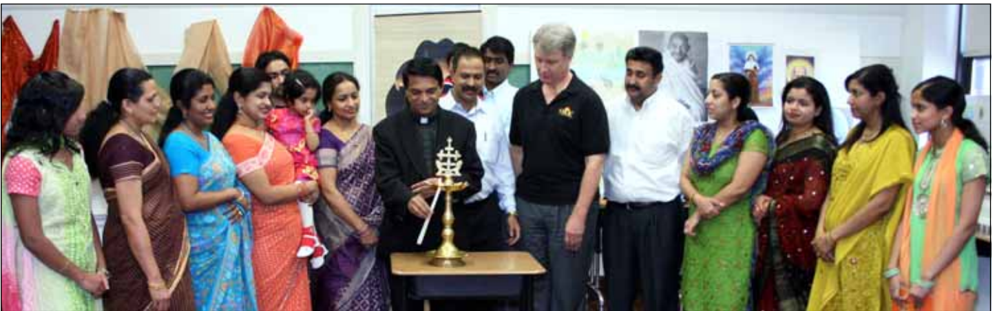
Inauguration photos of Kerala Expo at OLV School by St. Mary's Unit.

ഉയിർപ്പു ഞായർ (ഏപ്രിൽ 12) രാവിലെ 10:00 ന് ഇടവക പള്ളിയിൽ ദിവ്യബലി.