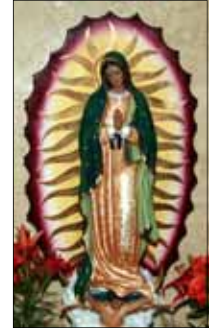
- ഒരു വിശ്വാസി