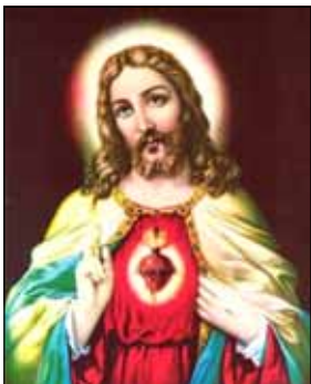
- Siby Kaithakkathottiyil