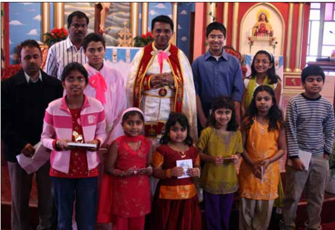
Photo Below: Best Religious Educations Students of the month at Maywood with vicar and organizers.