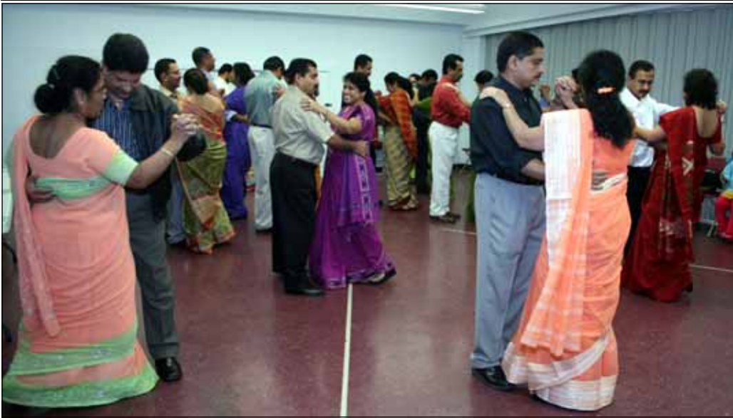
Dance Training for couples at Maywood.

ANNUAL RETREAT FROM MARCH 26-29. Details on page 7. Kulathuvayal Team.