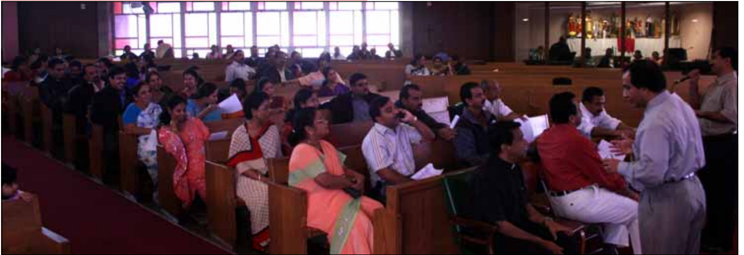
Photo Above: Planning session at Maywood Church on the pilgrimages to be held in 2009 under the guidance of Mathews Pilgrimage, Chicago.