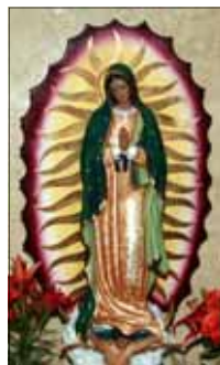
- Siby Kaithakkathottiyil