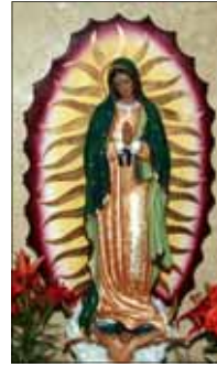
- Mathai Aikkaraprambil