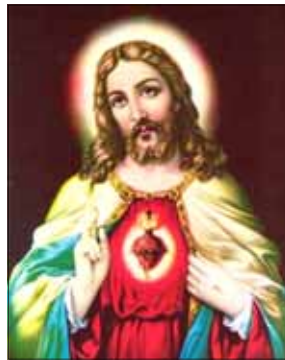
- തോമസ് & മേരി ആലുങ്കൽ