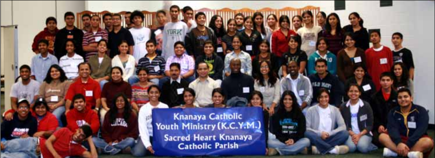
Participants of retreat organized by SHKC Parish Youth Ministry in Rockford during Christmas Holidays.