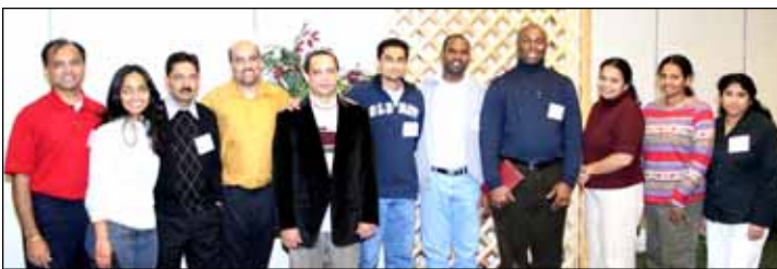
Team Leaders and Support Group

Throughout the whole retreat all of our bonds became stronger and we became closer with the people around us. I really enjoyed the privilege to have attended this gathering and to have met so many people. The retreat was entertaining and I learned more about myself and my abilities from it.